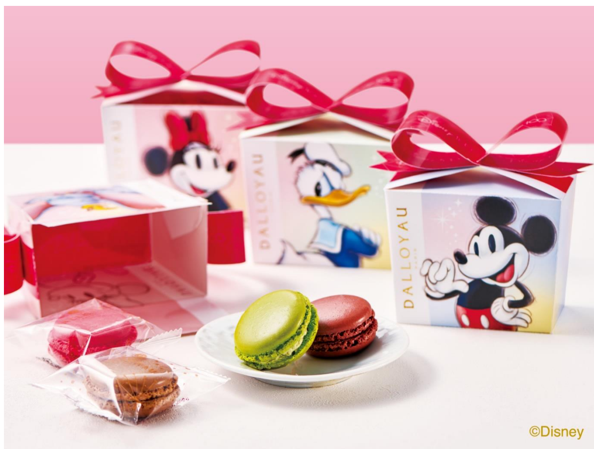
ディズニー100 マカロン詰め合わせ(2個入)