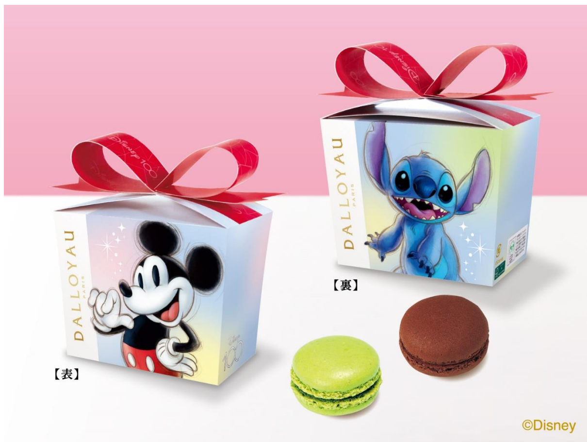
ディズニー100 マカロン詰め合わせ(2個入) ミッキー Maus & スティッチ