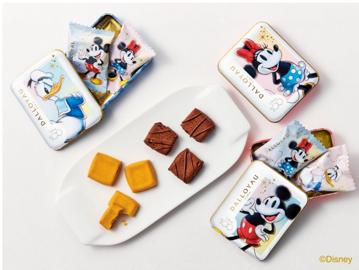
ディズニー100 ガトー缶