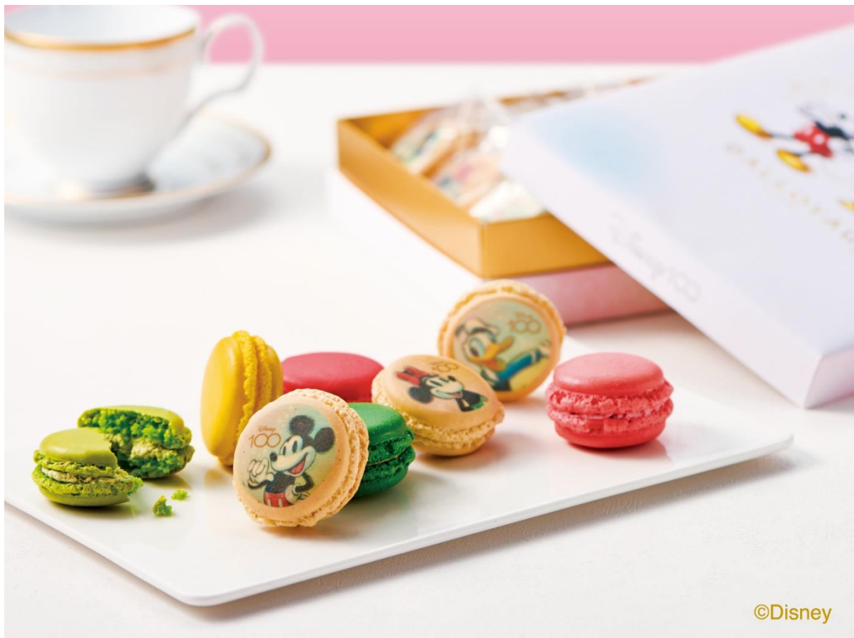
ディズニー100 マカロン詰め合わせ(18個入)

内容：マカロン(「ミッキーマウス」、「ミニーマウス」、「ドナルドダック」、ピスターシュ、フランボワーズ、シトロン、あまおう、ショコラ、テ ヴェール(宇治抹茶)) 各2個 計18個入