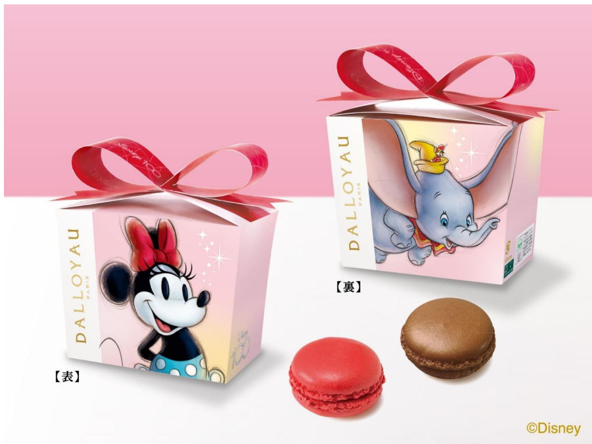
ディズニー100 マカロン詰め合わせ(2個入) ミニー Maus & ダンボ