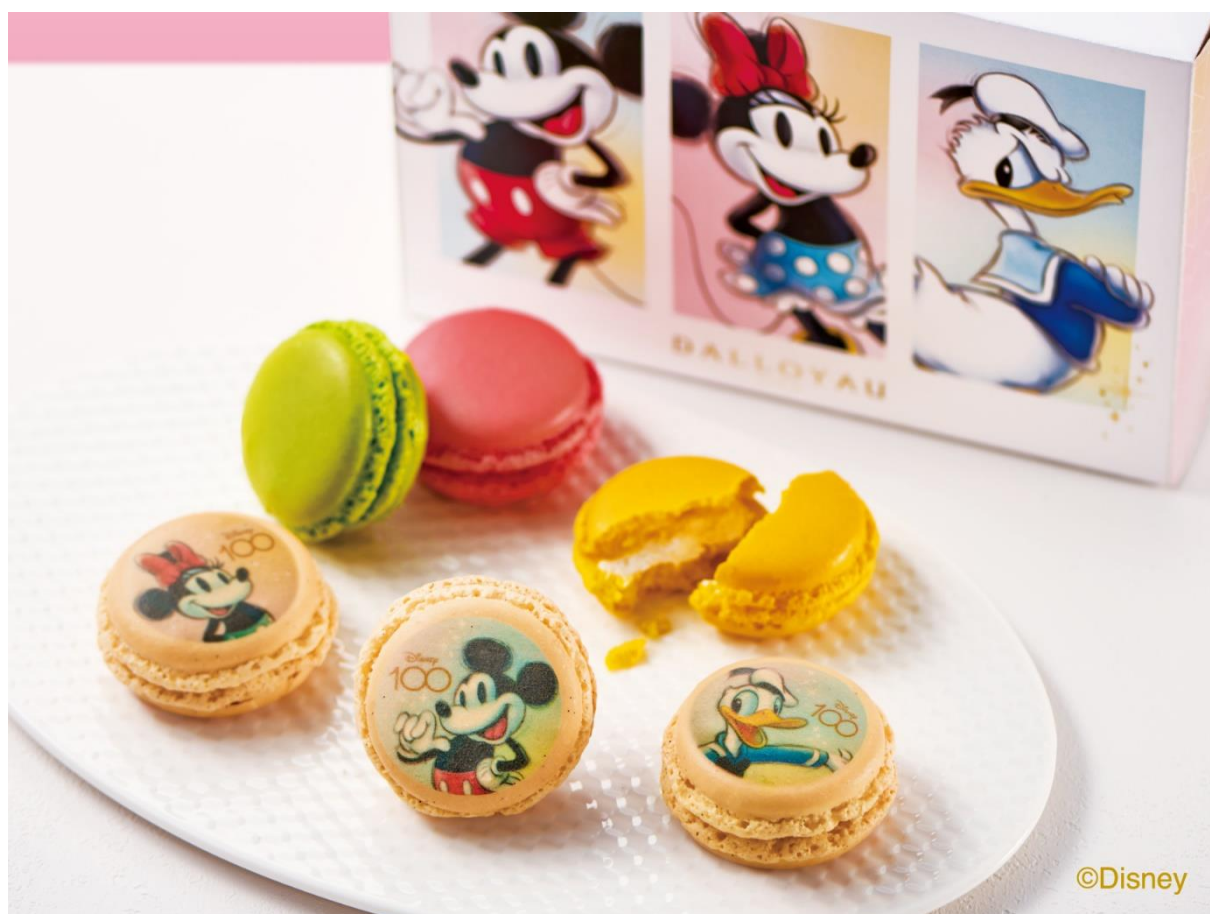
ディズニー100 マカロン詰め合わせ(6個入)

内容：マカロン(「ミッキーマウス」、「ミニーマウス」、「Donaldダック」、ピスターシュ、フランボワーズ、シトロン) 各1個 計6個入