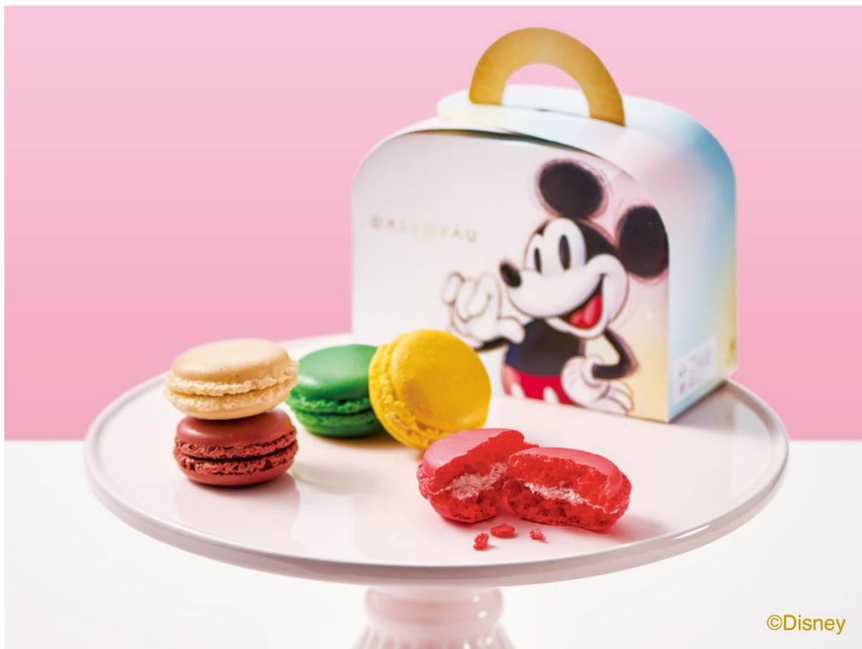
ディズニー100 マカロン詰め合わせ(5個入)

内容：マカロン(あまおう、テヴェール(宇治抹茶)、シトロン、ショコラ、キャラメル ブール サレ) 各1個 計5個入